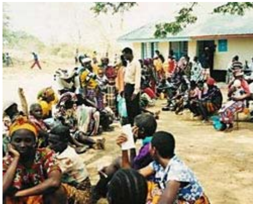
Dorfbewohner warten auf Behandlung durch den Arzt