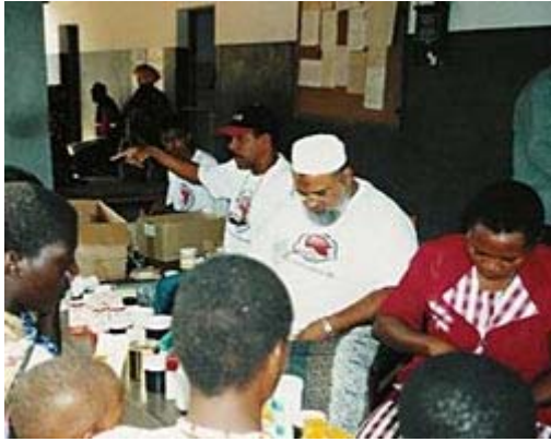
Team des Tawfiq Hospital bei der Ausgabe von Medikamenten

Die häufigsten Krankheiten sind Malaria, Lungenentzündung, Durchfallerkrankungen, parasitäre Infektionen, Asthma, Allergie, Bluthochdruck, Diabetes, sowie Infektionen von Augen und Ohren.