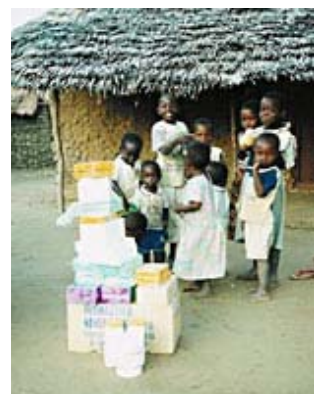
Mit Spenden aus Deutschland konnten dringend benötigte Medikamente gekauft werden.

Neben der Versorgung von Patienten in der Gesundheitsstation in Kokotoni führte die MDH 2002 in Zusammenarbeit mit unserem kenianischen Partnerkrankenhaus Tawfiq Hospital insgesamt vier „Mobile Sprechstunden“ in sehr abgelegenen Gegenden von Kenia durch.