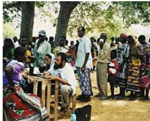
Sprechstunde unter einfachen Bedingungen

Die große Zahl der Patienten konnte nur durch gute Zusammenarbeit im Team versorgt werden. Zunächst wird jeder Patient registriert und erhält eine Karte mit seinem Namen, einer Wartenummer und persönlichen Angaben. Notfälle werden natürlich sofort behandelt. Beide Ärzte werden von einer Krankenschwester bei der Behandlung der Patienten unterstützt. Die Krankenschwester kann bei Bedarf auch von lokalen Dialekten ins Englische übersetzen.