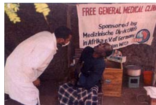
Sprechstunde unter einfachen Bedingungen