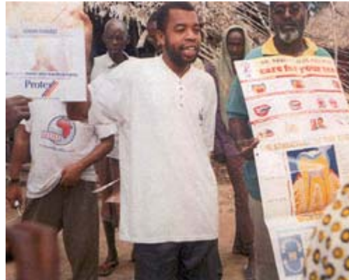
Während der "Mobilen Sprechstunden" wird Aufklärungsarbeit geleistet. Hier ein Bild vom Vortrag über richtige Zahnpflege.